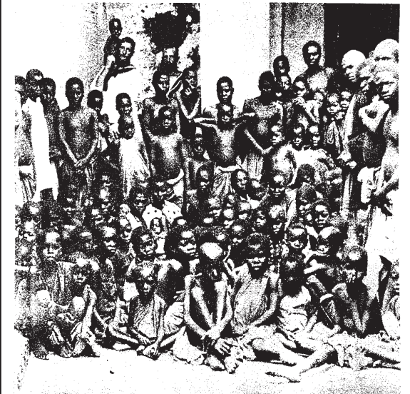
AFRICANI LIBERATI DALLE MANI DI UN NEGRIERO ARABO DEL ZANZIBAR NEL 1884 (Ofosu-Appiah, p.82)